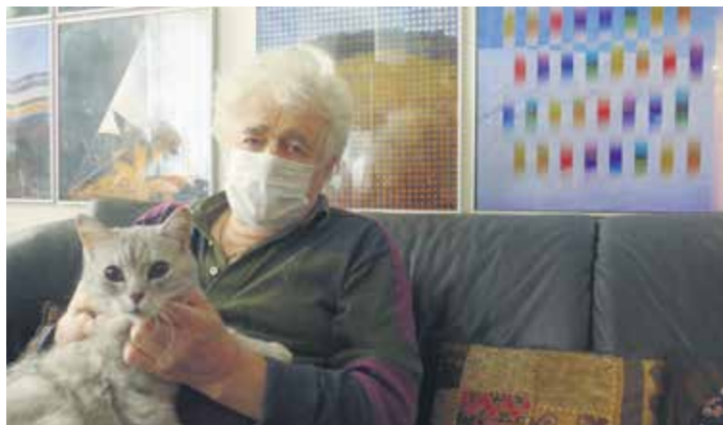
Francisco Infante-Arana (ex-SSSR/Rusija) u svom domu u Moskvi, 2020.