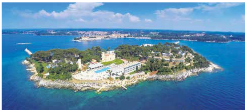
Valamar Collection Isabella Island Resort

razvoj destinacije glavni pokretači dugoročno održivog rasta i razvoja. Kao najveći i najpoželjniji poslodavac u turizmu Valamar svoje djelatnike kao i goste stavlja na prvo mjesto. Vrijednosti brenda Valamar All you can holiday se ogledaju kroz pet produkt brendova i Valamar programe s potpisom koji zajedno kreiraju savršen odmor i autentične doživljaje za svakog pojedinog gosta. Valamar je lider u inovativnom upravljanju odmorirnim turizmom i partner destinacijama gdje kroz odgovorno i održivo poslovanje stvara novu vrijednost za dioničare i lokalnu zajednicu.