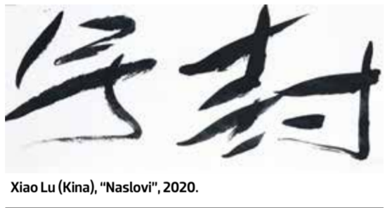
Xiao Lu (Kina), "Naslovi", 2020.