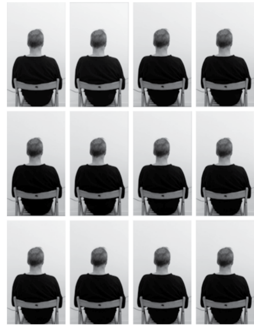
Santiago Sierra (Španjolska), "Autoportret u karanteni", 2020., scene iz video-rada