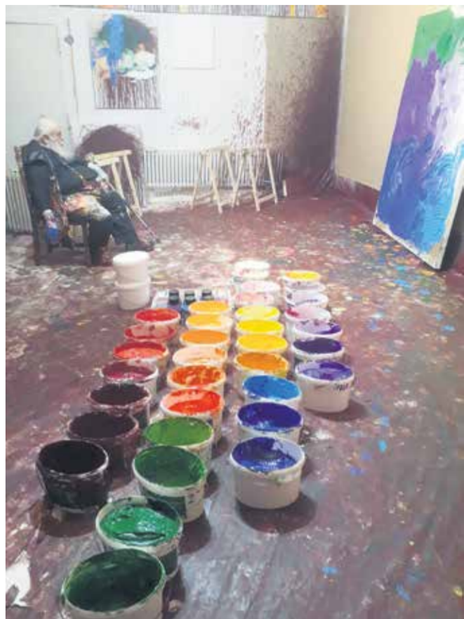
Hermann Nitsch (Austrija) u svom studiju u Prinzenendorfu, 2020.