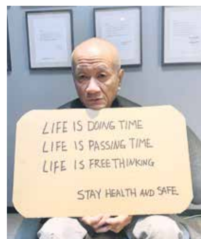
Tehching Hsieh (Tajvan/SAD) u svom domu u New Yorku, 2020.

NEKI OD NAJVAŽNIJIH SVJETSKIH UMJETNIKA SUDJELOVALI SU OVE GODINE U PROJEKTU "ARTISTS RESPOND" U ORGANIZACIJI INSTITUTA ZA ISTRAŽIVANJE AVANGARDE I KOLEKCIJE MARINKO SUDAC, A SLJEDEĆIH ĆE GODINA BITI DIO PROJEKTA "UMJETNIK NA ODMORU BY VALAMAR" U VALAMAR DESTINACIJI POREČ