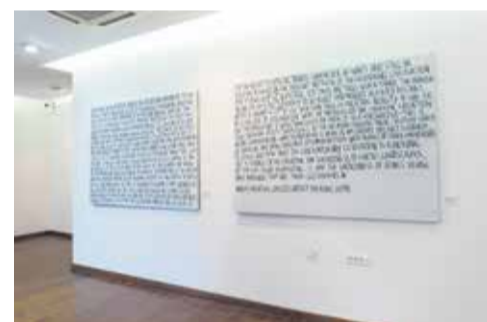
Detalji postava izložbe „Grupa OHO (1962 – 1971)“ u Galeriji Zuccato u Poreču, 2019. g.

novi OHO grupe stvarali, a osim njega stvarali su vizualnu i konkretnu poeziju, objavljivali OHO publikacije, izvodili performanse, akcije u urbanim prostorima, i mogu se u tome aspektu povezati s drugim srodnim praksama poput Fluxusa.