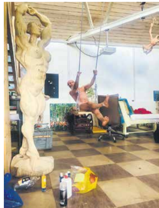
Oleg Kulik (Ukrajina/Rusija) u svom atelijeru u Moskvi, 2020.

Kao dokument ovog projekta i situacije koja ga je potaknula, uskoro će biti tiskana i dvojezična publikacija (na hrvatskom i engleskom jeziku) sa svim doprinosima umjetnika.