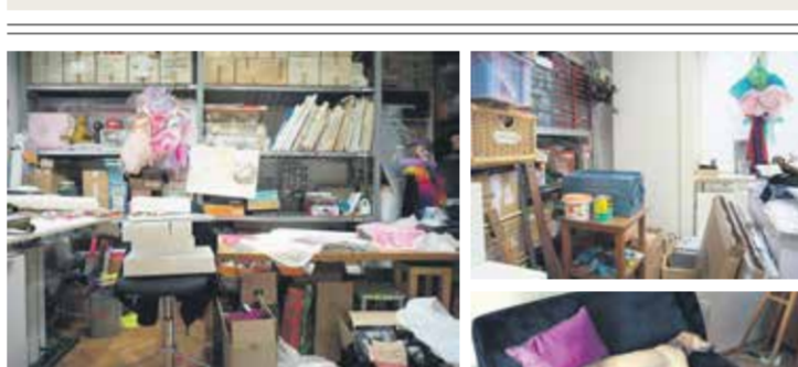
Renate Bertlmann (Austrija), "Studijski kaos", 2020.

Vremena su teška i ono što najviše uznemirava je nepredvidiva, situacija. Ne znate koliko dugo ćete biti u izolaciji, koliko ljudi će biti pogodeno, što očekivati. Ali Ilya i ja smo kao umjetnici navikli raditi u bilo kojim uvjetima te smo zadržali naš uobičajeni životni stil: naš rad je naš prioritet. [...] Ilya 30 godina svog umjetničkog života u Sovjetskom Savezu nije imao niti jednu izložbu, tako da je na neki način to jednostavno: "Povratak u SSSR", sa svim ograničenjima, izolacijom od svijeta i odsutnosti izlaganja. Razlika je u tome što se ograničavamo iz svoje društvene